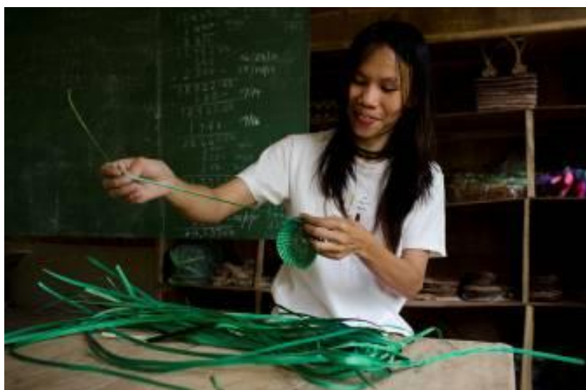
Beneficiaria haciendo labores de artesanía con técnicas locales

El proyecto facilita asistencia técnica para el desarrollo de las capacidades de todas aquellas instituciones en el análisis de género, el seguimiento y evaluación de políticas según el enfoque de Género y Desarrollo y la creación de alianzas sobre empoderamiento económico de las mujeres y derechos humanos.