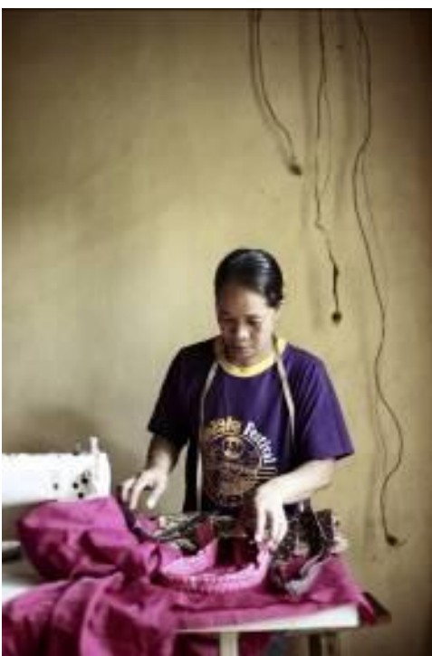
Beneficiarias del proyecto