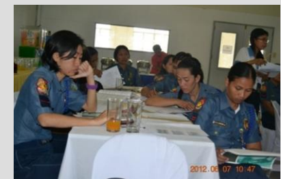
Formación en sensibilidad de género

Sistema Unificado de Información sobre Violencia de Género y Sistema de Seguimiento y Transversalización de Género